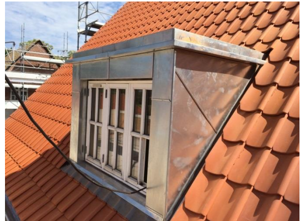
”BYGNING 1 RENOVERING AF KVIST”