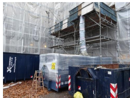
” etablering af lukket skakt med undertryk ”

Klimaskærmen har gennem mange år været repareret nødtørftigt til salg for øje, her er der valgt mere eller mindre uheldige miljøfarlige materialer til at tætte klimaskærmen, så klimaskærmen skulle miljøsaneres pga. fund af asbestholdig tætningsmasse mellem tagstene.