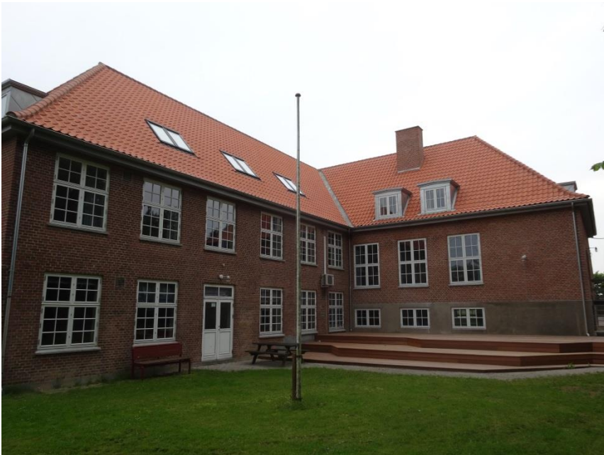
”Bygning 3 ny atriumgård, med hårdtræs terrasse”